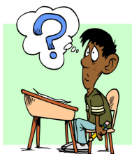
Herhaling van voorgaande les