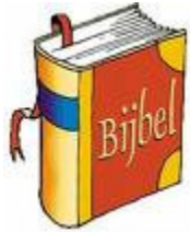
Bijbelgedeeltes om te lezen