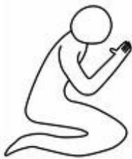
Tijd om te bidden