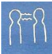
Praten met elkaar